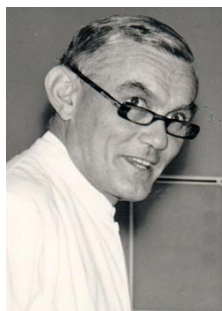
1. Per From Hansen