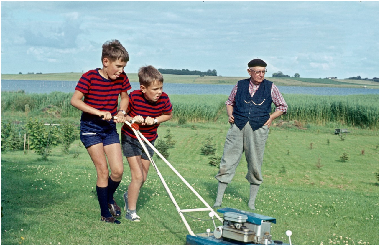
Foto fra udstillingen "Retrospective Family". Fra Inspiration til livsplakater af oplevelsesmedarbejder Liv Høybye