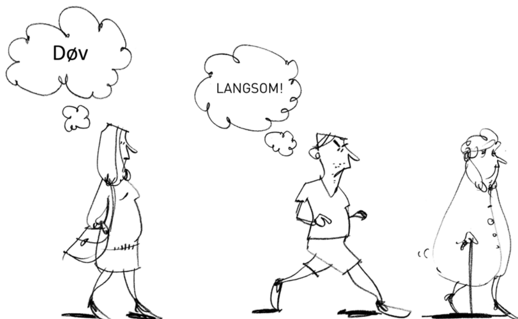
Alderisme er negative holdninger til en gruppe mennesker alene på baggrund af en vurdering af deres alder

I et studie af Lasonde og kolleger (2012) anvendtes et implicit mål for kognitiv alderisme til at opfange aldersrelaterede stereotyper i tekstpassager, der beskrev ældre mennesker. Forsøgsdeltagerne læste disse tekstpassager langsommere, når de indeholdt information, der beskrev adfærd, der var inkonsistent snarere end konsistent med aldersrelaterede stereotyper. Den nedsatte læsehastighed skyldtes, ifølge forfatterne, at læserne blev overraskede over indholdet, der ikke stemte overens med deres antagelser om ældre mennesker. Deltagerne udfyldte desuden en række spørgeskemaer, der målte eksPLICIT alderisme. Resultaterne viste, at der ikke var sammenhæng mellem eksPLICIT alderisme og implicit alderisme. Deltagere, der ikke viste tegn på eksPLICIT alderisme, udviste alligevel implicit alderisme.