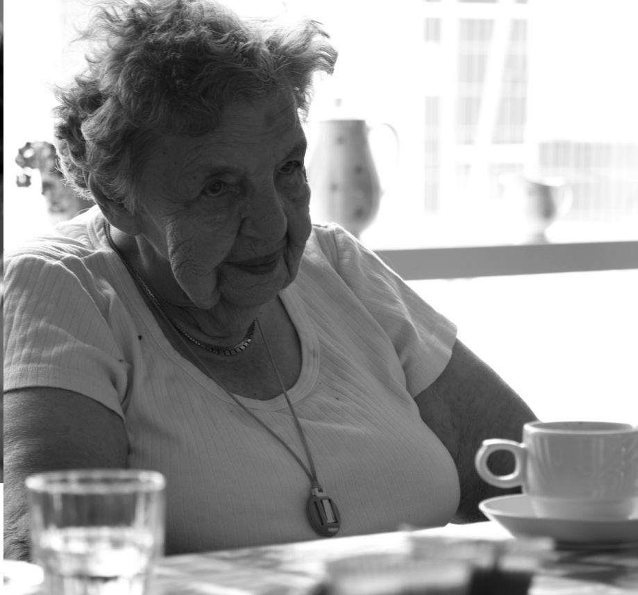
Fotos fra Bomi-Parken, København S.