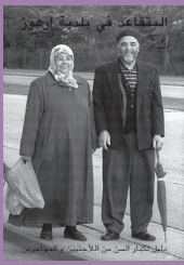
Informationsmateriale på arabisk.