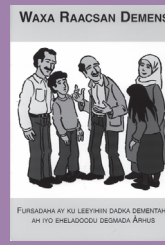
Information om demens på somalisk.

Det øgede kendskab og brug giver også en større tilfredshed: Tilfredshedsgraden blandt de ældre, som udelukkende modtager hjælp fra familien, er lavere (54%) end tilfredsheden blandt dem, der også modtager hjemmehjælp: Hele 84% af de ældre, der som en del af plejen modtager hjemmehjælp, er således tilfredse med den hjælp, de får.