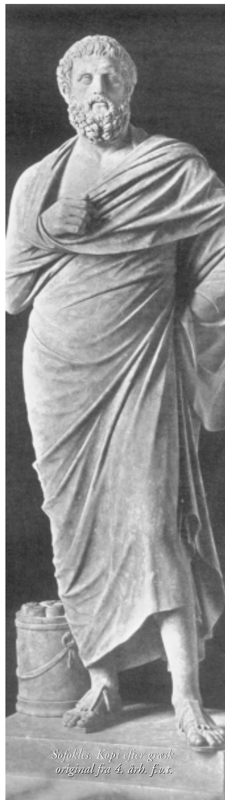
Sofokles. Kopi efter græsk original fra 4. årh. f.v.t.

Deri er Kefalos enig, for »når lidenskabene mister deres spænding og slappes, så er man sluppet helt fri for mange gale herre«. Men både heri og i forholdet til famili-