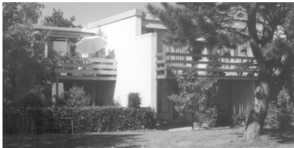
Huse med terrasse og forareal i det aldersintegrerede bofællesskab Skåplanet i Værløse.